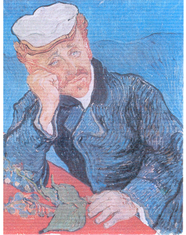
Resim 2. Doktor Gauchet'nin yüksükotu ile portresi

Epilepsi, porfiri, manik depresyon bu tanılardan hangisi Van Gogh'un hastalığıdır. Doktorların tanıları epilepsidir. Tıptaki deyişle elinizde