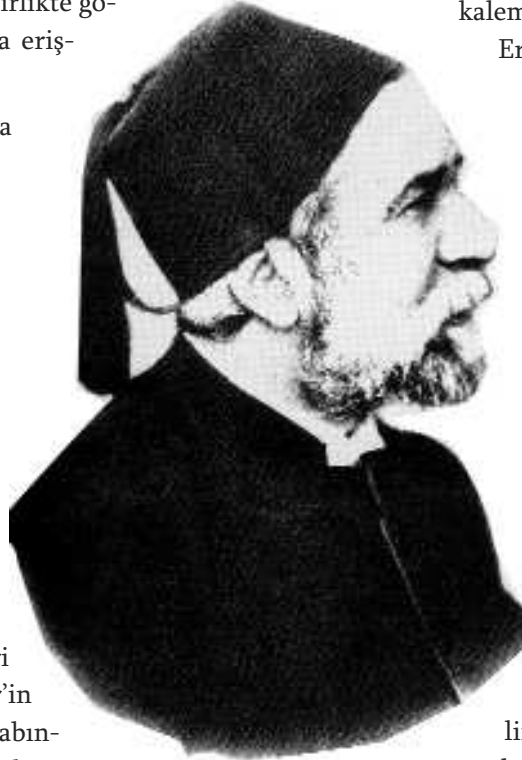
Abdülatif Suphi Paşa (1818-1886)