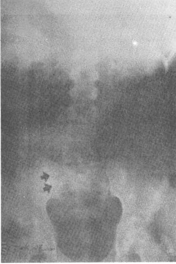
Şekil 1, Pelvis grafisi; sağ sakroiliak eklem sınırlarında düzensizlik, eklem aralığında daralma ve periartriküler skleroz (=») gözlenmektedir.