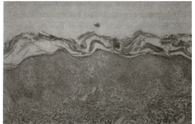
Şekil 3. Kesitte; yüzeyde hiperkeratoz, dermiste yer yer epidermisi de infiltre eden mononükleer iltihabi hücreler görülmekte. (H& E x 50).

Anamnez, klinik ve laboratuvar bulgularla karbamazepine bağlı hipersensitivite sendromu düşünüldü. Karbamazepin kesildi ve 40 mg/gün dozda oral prednizolon tedavisi başlandı. Tedavinin 3. gününde hastanın ateşi düştü, karaciğer fonksiyon testleri hızla düşerek, 7. günde normale döndü. Lenfadenopatileri 8. günde kayboldu (Şekil 4). Oral kortikosteroid dozu tedricen azaltılarak kesildi. Oral kortikosteroid kesildikten bir ay sonra hastaya Finn Chamber metodu ile deri yama testi uygulandı. Karbamazepin, % 3 ve %10' luk konsantrasyonlarda, distile su, vazelin ve % 70 etanol içinde hazırlandı. Deri reaksiyonları 48, 72. saatlerde ve 1 hafta sonra değerlendirildi ve şiddetine