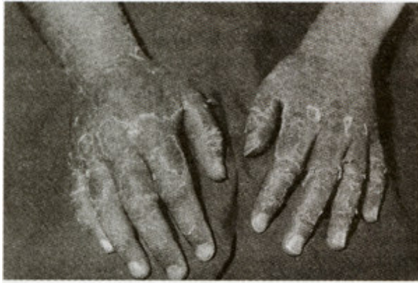
Şekil 1,2. Hastanın tedavi öncesi görünümü.

eritem ve deskuamasyon saptandı (Şekil 1,2). Oral mukozada, sert damakta peteşileri vardı.