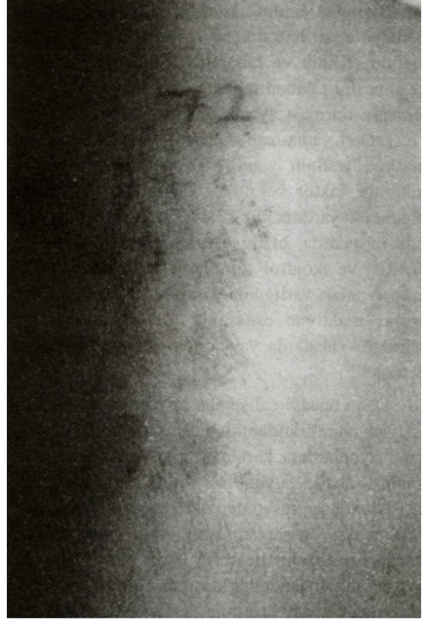
Şekil 6. 72. saatteki deri yama testi sonucu.

Etyopatogenezi tam olarak bilinmemektedir. Antikonvülzan ilaçlar, karaciğerde sitokrom P450 sistemi üzerinden metabolize olurken, arenooksitler adlı ara ürünler açığa çıkar. Normal kişilerde var olan epoksid hidrolaz enzimi, bu ürünleri detoksifiye ederek, zararsız hale getirir. Ancak AHS gelişen bireylerde bu enzimin eksik veya fonksiyonun bozuk olduğu saptanmıştır. Bu nedenle ortaya çıkan ara ürünlerin hücrelerle etkileşerek, toksik veya immünolojik olaylarla AHS'ye neden olduğu düşünülmektedir (1,2,5,11,12). Epoksid hidrolaz geninde mutasyon saptanması ve olguların kardeşlerinde de AHS gelişme riskinin artmış olması genetik bir zemini akla getirmektedir. AHS'li olgularda in vitro lenfosit transformasyon ve deri yama testlerinin pozitif oluşu, ilaca spesifik CD 4 ve CD 8 T lenfositlerinin ve \gamma -IFN'nun artmış