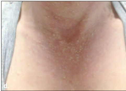
RESİM 1a-d: Alopesi ve papüler lezyonların yaygınlığı. (Renkli hali için Bkz. http://dermatoloji.turkiyeklinikleri.com )