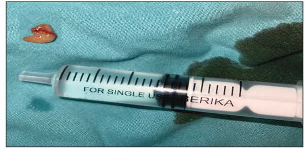
RESİM 2: Eksizyonel biyopsi ile çıkarılan lezyon.

Yirmi üç yaşında kadın hasta sol dizde olan kahverengi ağrılı şişlik nedeniyle kliniğimize başvurdu. Hasta lezyonun bir yıldır olduğunu ve boyutunun değişmediğini ifade etti. Dermatolojik muayenede sol diz lateralinde muayene ile ele gelen 1x1 cm boyutlarında grimsi, sert, hassas, soliter nodül mevcuttu (Resim 1). Hastanın öz geçmiş ve soy geçmişinde özellik yoktu. Hastanın hemogram, biyokimya ve tam idrar tetkiki normaldi. Dermatoskopik bakışında homojen grimsi renk izlendi. Lezyon eksizyonel biyopsi ile alındı (Resim 2). Lezyonun hematoksil-eozin ile boyalı kesitlerin histopatolojik incelemesinde iyi sınırlı uninodüler fokal kapsül yapısı izlendi. Lenfositlerle karışık hâlde merkezi yerleşimli büyük soluk hücreler ve periferde küçük koyu renkli bazaloid hücre-