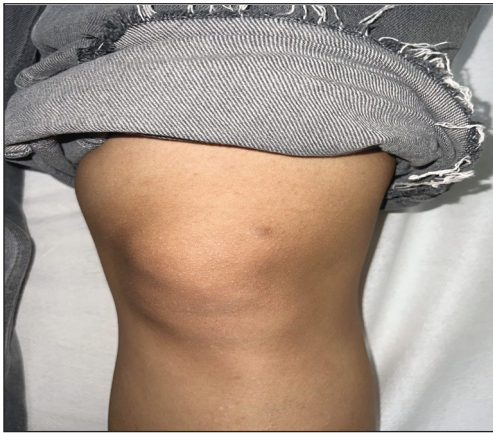
RESİM 1: Sol bacakta hiperpigmente görünen lezyon.

relerden oluşan trabeküller, retiküler yer yer solid dizilim gösteren vasküler yapıların belirgin olduğu gözlemlendi (Resim 3). Bu klinik ve histopatolojik bulgular eşliğinde tanınız nedir?