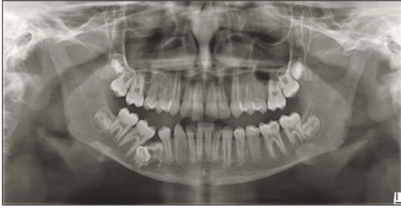
RESİM 1: Primer gömülü alt çene sağ süt ikinci azı dişi.