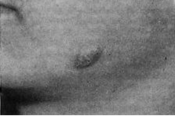
Şekil 2. Papulonodüler tipte lezyonu olan bir olgu (kuru tip)