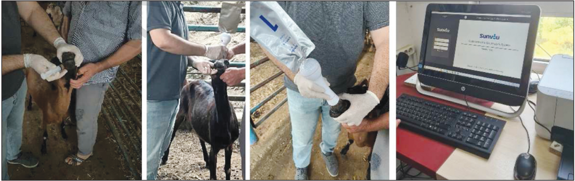
RESİM 1: Sırası ile a) laktuloz (Sibolac®, RDA Grup, İstanbul, Türkiye) laktuloz solüsyonundan 10 mL keiye iirilirken, b ve c) iki farklı keide nefes yükleme testi esnasında özel torbalara doldurulan gazın analizi yapılmadan hemen evvel ve d) bilgisayar aracılığında nefes torbalarının Sunvou Nefes Analizatörüne yüklenmeden hemen evvel software programının ve cihazın açılımı ile yüklenmesi.

Tablo 1'de gösterildiėi üzere grupların kendi ierisinde karşılařtırmasında fark ıkmasa da ölçüm zamanlarının hepsi farklı ıkmıřtır. Laktuloz yüklemesi sonrası sırası ile 0, 30, 60 ve 90. dk'lar karşılařtırıldıėında sabah 08.00 verileri ile öğlen 12.00 deėerleri arasında belirgin istatistiksel farklılıklar Tablo 1'de sunuldu. Sabah 08.00 (27 °C) ile öğlen 12.00 (43 °C) tekrarlayan 4'lü ölçümlere göre öğlen metan gazı salınımının, sabaha göre daha