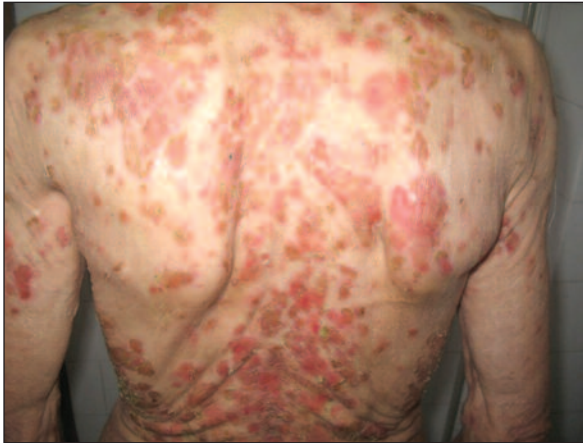
RESİM 2: Gövde arka yüzde benzer karakterde yaygın lezyonlar.

veya stratum granulosum içinde akantoliz görülür. İmmünfloran incelemede intersellüler IgG, C3 ve nadiren de IgA birikimi saptanır. Histopatolojik değişiklikler pemfigus eritematozus ile benzerdir fakat klinik olarak pemfigus eritematozus lokalizedir ve lupus eritematozusu taklit eder. 1