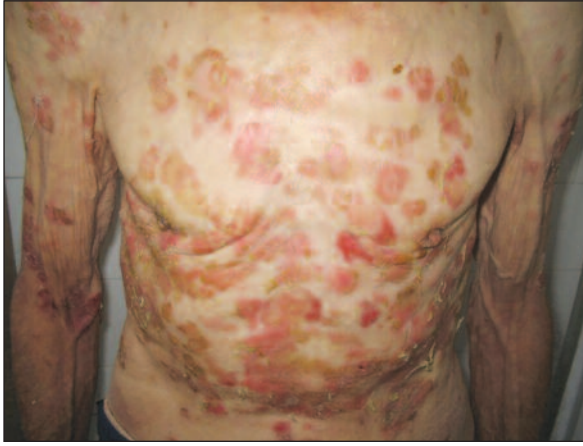
RESİM 1: Gövde ön yüzde eritemli, bazılarının üzeri kurutlu yüzeysel erozyonlar.