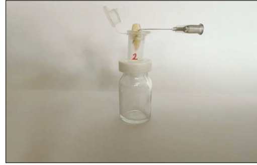
RESİM 1: Debrisin toplanması için kurulan düzenek.

Bir web programı aracılığı ile ( www.random.org ) dişler rastgele 3 gruba (n=15) ayrılmıştır. Tüm eğe