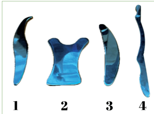
ŞEKİL 2: Tedavide kullanılan enstrümanlar [Fizultra® (Fizyoshop, İstanbul, Türkiye) graston set].

Her iki gruptaki hastalara 4 hafta boyunca haftada 2 kez 10-12 tekrarla birlikte 10 dk boyunca EDYDM enstrümanları ile uygulama yapıldı. 15 EDYDM grubuna sadece EDYDM, plasebo grubuna ise plasebo EDYDM uygulandı. Tedavide kullanılan enstrümanlar Şekil 2’de gösterilmiştir. Uygulama ile ilgili bölgeye hafif vazelin sürülerek doku üzerinde aletlerin kayması sağlandı. Lomber arka kas erektör spinae (iliocostalis, longissimus) kasları palpe edildikten sonra bölgeye vazelin sürüldü. Yüzeysel uygulama için 3 numaralı enstrüman seçildi ve konkav yüzeyi