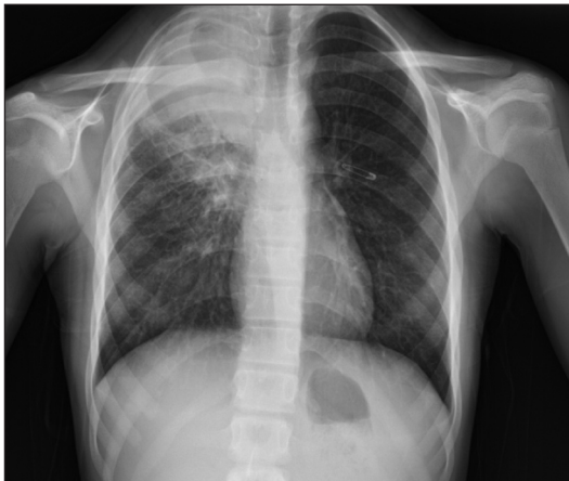
RESİM 1: Posteroanterior akciğer grafisinde sağ üst zonda hilus ile bağlantılı infiltratif opasite ve apekte şüpheli kitle görünümü.

Hasta, göğüs cerrahisine konsülte edildi. Göğüs cerrahisi tarafından değerlendirilen hastanın lezyon yerinden biyopsi alındı. Biyopsi sonucunda; kronik ksantogranüloamatöz inflamasyon, aktinomiçes kolo-