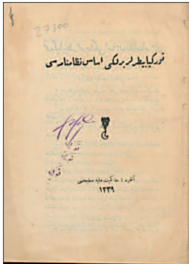
RESİM 3: Türkiye Baytarlar Birliği Esas Nizamnamesi (1920).

Osmanlı Devleti'nde veteriner hekimliği alanında kurulan son dernek "Türkiye Baytarlar Birliği" adıyla 1920 yılında Ankara'da faaliyete başlamıştır (Resim 3). Dernek, dönemin Müdafaa-i Mil-