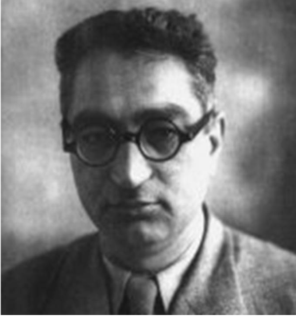
Resim 1. Osman BAYATLI (1892–1958).

man Bayatlı'nın "Bergama tarihinde Asklepion" kitabının önsözüne bu onarımlar konusunda; "Kuzey koridorun bu yeni düzeni yalnız turistlere değil, aynı zamanda arkeoloji alemine de büyük bir hizmet olmuştur. Asklepion'a girdiğimizde ince endamlı mermer sütunların asil duruşunun bizi selamlamasını ve teşhir etmesini ona borçluyuz. Bu onarım, yerde yatmakta olan mermerleri yıpranmadan korumakla beraber, Dikili depremi gibi oldukça şiddetli iki depremi atlatacak kadar da dayanıklı olmuştur 5 " satırlarını yazmıştır.