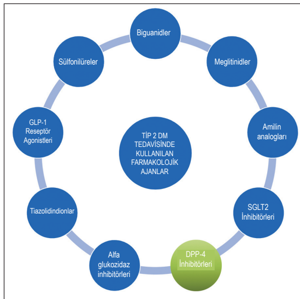
ŞEKİL 2: Tip 2 DM tedavisinde insülin harici kullanılan farmakolojik ajanlar. 13,16,30 DM: Diabetes mellitus; SGLT2: Sodyum-glukoz kotransporter 2; GLP-1: Glukagon benzeri peptid-1; DPP4: Dipeptidil peptidaz 4.

Tip 2 DM'li hastaların tedavisinde yaygın olarak kullanılan insülin sekretagolardır ve pankreatik beta hücreler tarafından glukoz bağımsız olarak insülin salımını doğrudan uyararak kan glukoz seviyelerini düşürürler. 1950'lerde geliştirilen ilk nesil sülfonilüreler (asetoheksamid, tolbutamid, klorpropamid, to-