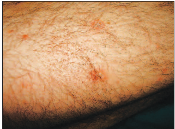
ŞEKİL 2: Bacakta numuler üzeri kurutlu yama ve plaklar.