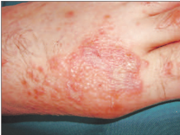
ŞEKİL 1: Ayak sırtı ve medialde grup yapmış veziküller.

Burada dizhidrotik egzama ön tanısı ile yıllarca topikal steroidli kremler kullanmış fakat fayda gör-memiş, el ve ayakta daha belirgin grup yapmış vezikülleri bulunan pemfigus herpetiformisli bir ol-gu sunuldu. Olgumuzda lezyonların mevsimsel özellik göstermeksizin yıl boyu devam etmesi, el ve ayak dışında da lezyonlarının olması, oral tutulu-mun gözlenmesi, numuler plaklarının bulunması ve lezyonların tedavilere dirençli olması gibi özel-likler dizhidrotik egzama aleyhine idi. Bu nedenle yapılan Tzanck yayma incelemesinde tadpole hü-creleri yanında akantolitik hücrelerin görülmesi ve yaymadan yapılan immünofloresan incelemede bu akantolitik hücrelerin çevresinde IgG birikiminin