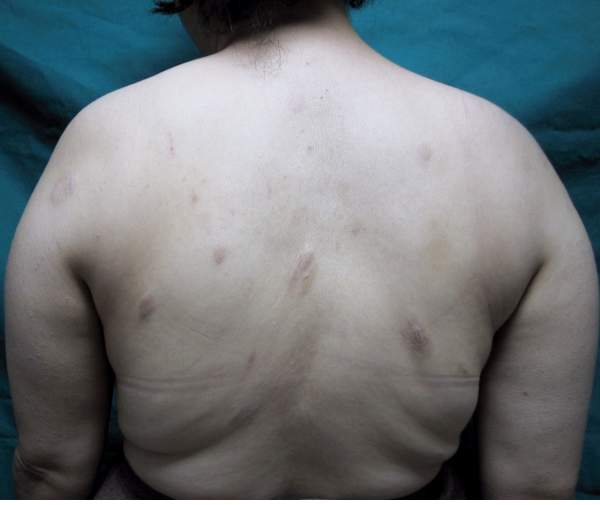
Resim 1. Oval şekilli, herniasyon gösteren eritemli, atrofik görünümlü yamalar.