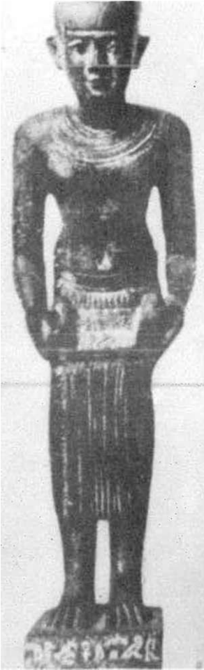
Resim 1. imhotep (Yaklaşık olarak M.Ö. 3000) Bilinen ilk Hekim Andı yazarı.

"Bu okulun Hocalarıyla sevgili arkadaşlarımla karşısında ve imhotep'in resminin önünde, yüce varlık