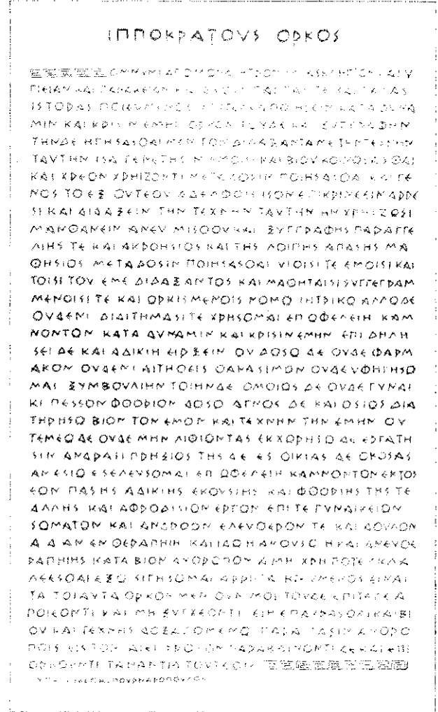
Resim 3. Hipokrat'ın yazdığı Hekim Andı metni (Grekçe).

Campbell ve Vanderpool'a göre Hipokrat Andı zamanının hukuk ve tıp pratiğini yansıtmıyordu ve o zaman ki hekim davranışları And'da yazılanlardan farklıydı. O dönemin tıp kurumu, uygulamaları ve sosyal çevre kabaca şöyle çizilebilir: Hipokrat zamanında hekimlik iyi örgütlenmemiş bir loncaydı. Herhangi bir kişi hekimim diye ortaya çıkabiliyordu. Hekimi şarlatandan ayırmak kolay değildi. Hastaya acısını dindirmek için kolaylıkla zehir verilebiliyordu. Toplum düzenindeki çarpık ilişkiler ve bunlardan doğabilecek istenmeyen çocuklara rahatlıkla "kürtaj" (ya da fetüsü düşürme girişimleri) yapılıyordu (1). Bunlardan da anlaşılabilir gibi Hipokrat Andı o zamanın yaygın tıp uygulamasına karşı yazılmıştır ve Yunan tıbbında bir reform hareketidir.