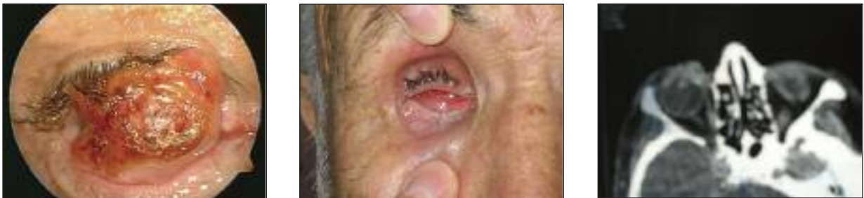
RESİM 2: Leomyosarkom olgumuzun ameliyat öncesi ve sonrası görünümü, ameliyat öncesi orbita tomografisi.

Tümör eksizyonundan sonra ilave tedavi olarak uygulanan kriyoterapi, konjunktiva serbest ke-