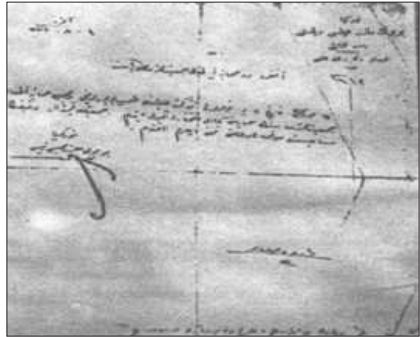
RESİM 2: Atatürk'ün Himaye-i Etfal'in koruyuculuğunu kabul ettiğini gösteren belge. Türkiye Büyük Millet Meclisi Riyaseti, Baş Kitabeti, Evrak ve Tahrirat Kalemi, 1143. Ankara, 1.8.337.

Bazı üniversiteler, üniversite bünyesinde çocuk bakımı kürsüleri kurmuş, çocuk yetiştirme