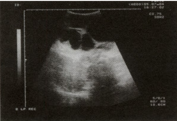
Resim 1. Kitlenin ultrasonografik görüntüsü; Karın ultrasonografisinde çok sayıda septasyon ve solid komponentler içeren anekoik kistik kitle.

Lenfanjiomlar benign lezyonlar olup sıklık sırası ile baş- boyun, toraks, pelvis ve karın içinde yer-