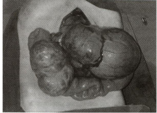
Resim 3. Kitlenin ameliyat sırasındaki görünümü; Treitz bağının yaklaşık 10 cm distalinden jejunum mezosundan başlayan en büyükleri yaklaşık 18x20 ve 8x10 cm boyutlarında çok sayıda kistik kitle.

leşirler. Karın içinde ise en sık retroperitoneal yerleşimli olup, nadiren periton içinde yerleşirler. Periton içinde genellikle ince barsak mezosu ve omentumda yerleşir. Periton içinde yerleşen kistik lenfanjiomlarda klinik, kitlenin çapı ve oluşturacağı komplikasyonlara göre değişmektedir. Hastalar süregelen karın ağrısı, basıya bağlı barsak tıkanıklık bulguları (karın ağrısı, kusma), kistin enfeksiyonu, torsiyonu, periton içine açılması ile akut karın kliniği ile başvururlar. 1,4 Çoğu kez kitle küçük olduğu için klinik bulgu vermez ve başka nedenlerle tetkik edilirken USG'de tesadüf olarak bulunur. Bazen de kanamaya bağlı anemi bulguları ile başvurabilir-