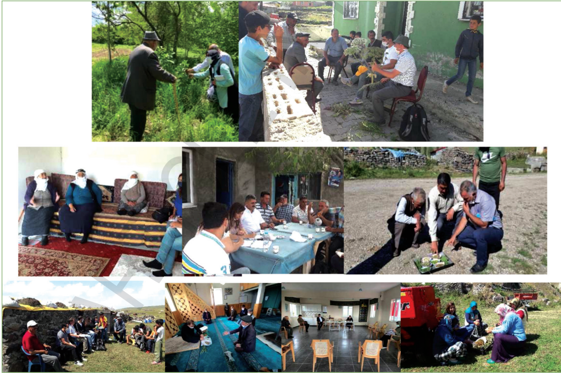
RESİM 1: Saha araştırmalarını gösterir temsili görüntüler. A-B: Heracleum pastinacifolium K.Koch bitkisinin sahadan toplanılması ve bitkinin romatizmal hastalıklarında kullanımının tarif edilmesi. C,D,E,F,G,H,I: Ev ortamı, kahve önü, sokak, bahçe, cami, dernek, kapı önü gibi ortamlarla yüz yüze görüşmelerin yapılması.

Numuneler, çeşitli bitki türlerinin belirlenmesini sağlamak amacıyla geniş bir coğrafi alandan temin edilmiştir.