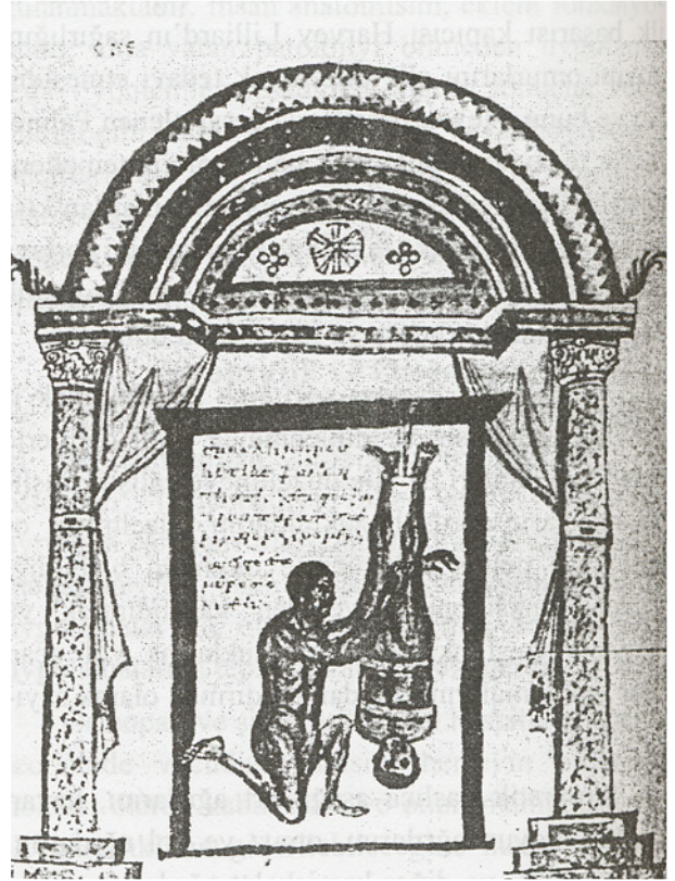
Şekil 2. Traksiyon ve Manipulasyon'un Birlikte Uygulanışı

kırık ve çıkıklarda traksiyon ve manipulasyon uygulamalarını ayrıntılı olarak resim ve şekillerle göstermiştir (Şekil 3).