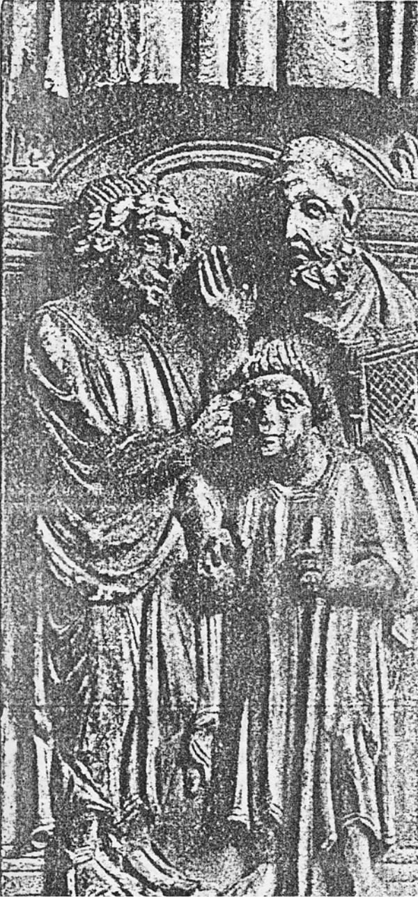
Şekil 4. Fildişi heykelle (6.yy) kör bir insanın mucizeyle yeniden görme gücünü kazanması.

İlkel çağlarda inanılan ve bugün de hala bazı yerlerde varlığını sürdüren hastalıkların tedavisine