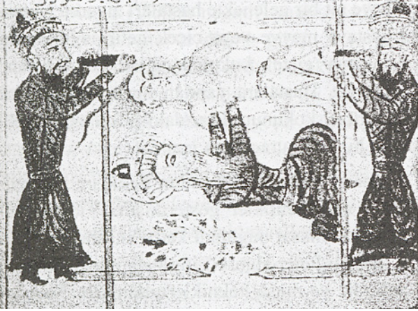
Şekil 3. Şerefettin Sabuncuoğlu, Sırt ve Bel Omurlarındaki Çıkıklarda Uygulanacak Tedavi.