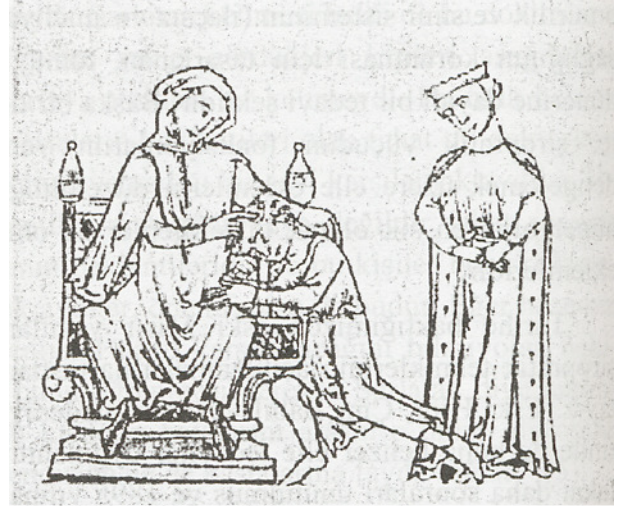
Şekil 1. Parmalı Roger, Chirurgia

Traksiyonun tarih boyunca kırık, çıkık ve omurga hastalıklarının tedavisinde kullanıldığı bilinmektedir. Hipokrat, skolyoz ve artmış kifoz gibi spinal bozukluklar için traksiyonu önermiştir (11). Tarihte 9. yüzyılda Bizans’da Niketas, İspanya’da Arap hekim El Zehravi, 11. yüzyıl başlarında Kordoba’da Al-Tasrif’de traksiyonu tanımlamıştır. İbn Sina (980- 1037) da ‘Kanun’da traksiyon ve elle yapılan uygulamaları tarif etmiştir. Türk hekim Amasyalı Şerefettin Sabuncuoğlu (1385-1468)