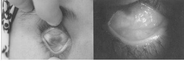
Şekil 3. (a) Olgu 4: Cerrahiden önce VKK, alt ve üst forniksde darlık ve semblefaron izleniyor ve (b) amnion membran transplantasyonundan sonra derin forniks izleniyor.

3. olgu: 4 ay önce kireç yanığı geçiren olguda VKK, tüm kapak ve bulbus konjunktivasında tamamen yapışıklık mevcut idi. Göz hareketleri tüm yönlerde tamamen kısıtlıydı. Sağlam konjunktiva mevcut değildi. Olgu 18 yaşında idi. Ameliyat öncesi görme el hareketleri düzeyinde idi. Daha önce 1 kez müköz membran grefti yapılan bu olguda tüm fibrotik dokular temizlenerek kapaklar bulbusdan ayrıldıktan sonra forniksler tahmini apekse kadar diseke edildi ve tüm açıkta kalan bölgelere amnion membran transplantasyonu yapıldı. Forniks teşkili için iki adet U sütür yerleştirildi. Takip süresi 6 ay olup son görmesi bir metreden