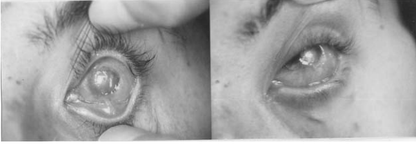
Şekil 2. (a) Olgu 2: Cerrahiden önce VKK, alt ve üst forniks darlığı ve semblefaron izleniyor ve (b) amnion membran transplantasyonundan sonra derin forniks izleniyor.