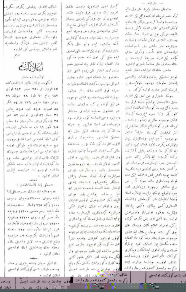
Şekil 4. H:1327/M:1909 tarihli Edirne Gazetesinde Ethem imzasıyla çıkan makale

getirilen dört kişi ile beraber on beş akıl hastasının tedavilerine devam edilmekte olduğu bildirilmiştir (12).