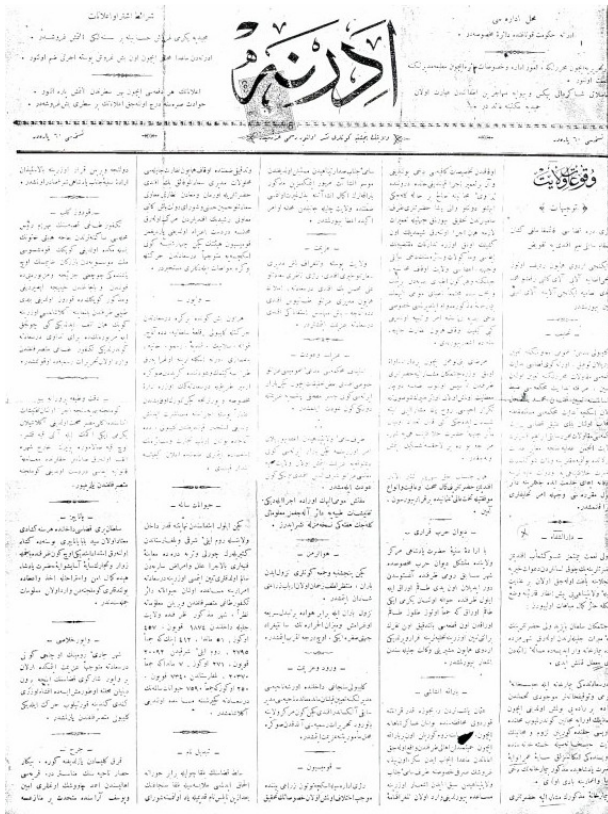
Şekil 3. H:1311/M:1893 tarihli Edirne Gazetesi

İstanbul'dan gelen bu yazıdan sonra, gereken ihtiyaç üzerine, dârüşşifa, tamir edilerek, R: 11 Teşrîn-i sâni 309 / M: 23.11.1893 tarihinden itibaren akıl hastalarının tedavilerinin yapılması amacıyla hizmete açılmıştır (7).