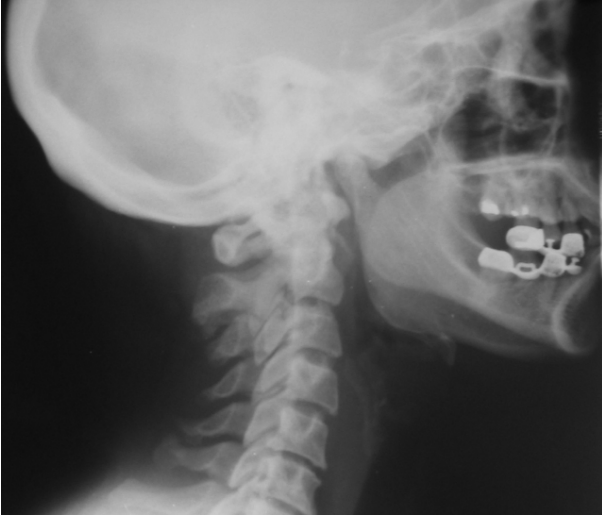
Resim 1. Zor entübasyon grubundan bir olgunun lateral servikofasiyal grafisi.