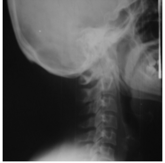
Resim 2. Zor entübasyon grubundan bir olgunun lateral servikofasiyal grafisi.

nin, tiromental aralık ile başın tam ekstansiyonunun değerlendirilmesinin zor entübasyonun öngörülmesinde değerinin az olduğunu bildirmişlerdir (13). Zor entübasyonun preoperatif öngörülmesinde yumuşak dokuların magnetik rezonans görüntüleme ile incelenmesi, 21 ayı parametrenin ölçümü ile araştırılmış ve aradaki farkın anlamsız olduğu bildirilmiştir (15).