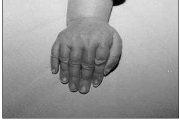
RESİM 2: Elde postaksiyel hegzadaktili.