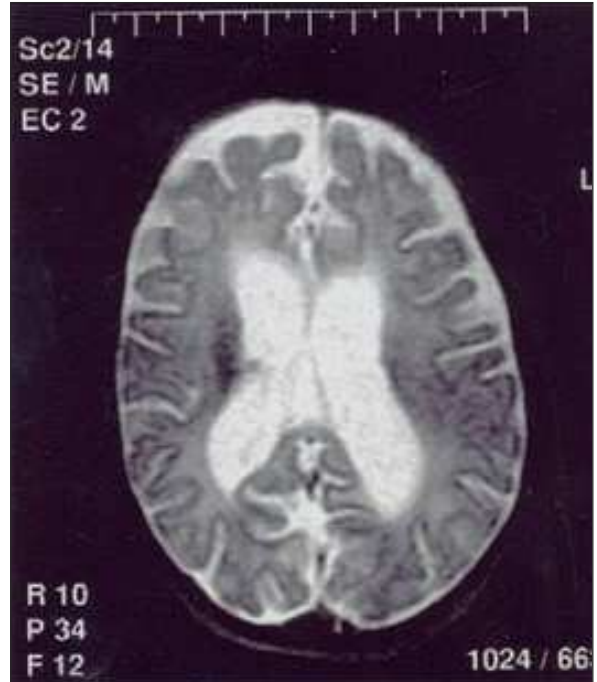
RESİM 6: Kraniyal manyetik rezonans görüntüleme hidrosefali.

MGS, çocukluk yaş grubunda görülen, otozomal resesif geçişli, yüksek mortalite ve morbiditeyle seyreden bir hastalıktır. Olgularda intrauterin dönemde başlayan renal patolojiye bağlı oligohidramniyos gelişir ve bu da pulmoner hipoplaziye neden olur. Akciğer maturasyonunun tamamlan-