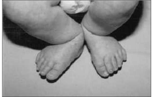
RESİM 3: Ayakta bilateral postaksiyel hegzadaktili.

2) ve 6. parmaklarında klinodaktili, bilateral ayaklarda postaksiyel polidaktili (Resim 3) saptandı. Nörolojik muayenesinde; bilateral ışık refleksi alınıyordu, yaygın hipotoni, baş kontrolü yoktu, derin tendon refleksleri artmış, sol gözde strabismus ve horizontal nistagmus mevcuttu.