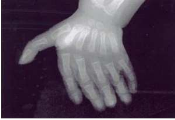
RESİM 4: Elde başparmak proksimal yerleşimli ve altıncı metakarp uzantısı olan parmakta iki falanks yapısı.