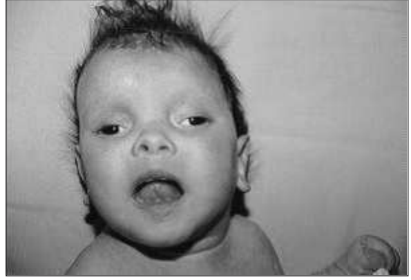
RESİM 1: Fasiyal dismorfik bulgular.

6 ay 15 günlük kız olgu, gelişme geriliği, multipl konjenital anomali, bronkopnömoni ön tanılarıyla hastanemize yatırıldı. Aralarında birinci derece kuzen evliliği tariflenen sağlıklı ailenin ikinci çocuğu idi. Olgunun düzenli ultrasonografik izlemi yapıldığı bildirilen gebelik sonrası, zamanında, vajinal yol ile 3600 gram ağırlığında doğduğu ve doğumunun 3. haftasında ensefalosel operasyonu olduğu öğrenildi. Gelişme geriliği ve hipoaktivitesi olan bebeğin fizik muayenesinde vücut ağırlığı 5270 g (<3p), boy 61 cm (<3p), baş çevresi 40 cm (<3p), oksipital bölgede ensefalosel operasyonuna bağlı skar, belirgin ve geniş alın, hipertelorizm, basık burun kökü, küçük burun, düşük kulaklar, dar ve yüksek damak, makrostomi, kısa boyun (Resim 1), ellerde bilateral proksimal yerleşimli başparmak, postaksiyel polidaktili (Resim