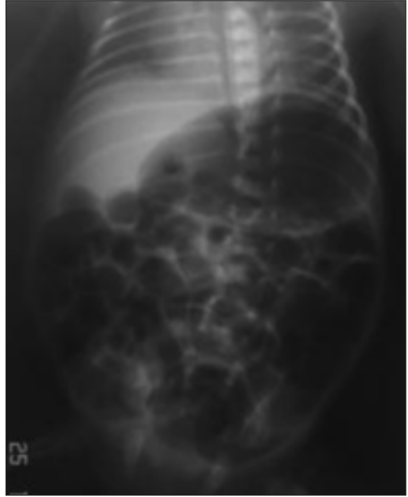
RESİM 1: Göz damlaları sonrası gelişen gastrik dilatasyon ve ileus tablosu.