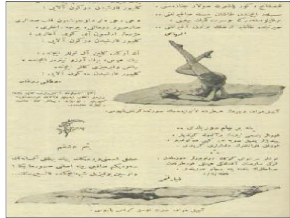
RESİM 4: Kadın Beden Terbiyesi, Servet-i Fünun. 1660-186. Sahife 57.

Bununla birlikte, ülkemizde doktora olan ihtiyacın fazlalığı ilerleyen yıllarda kadınlara bazı kolaylıkların sağlanmasına sebep olmuştur. Türk kadın doktorların 10 sene süresince zorunlu hizmetten muaf olmalarının Meclis görüşmelerinde gündeme geldiği "8 Teşrinisani 1339 tarih ve 369 numaralı etıbbâ hizmet mecburesi hakkındaki kanunun 7. maddesi ile 11