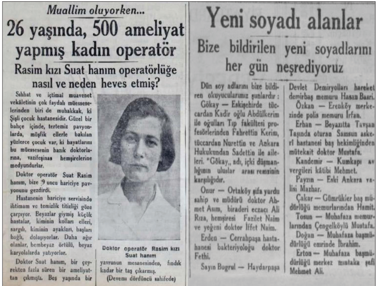
RESİM 3: Akşam Gazetesi.