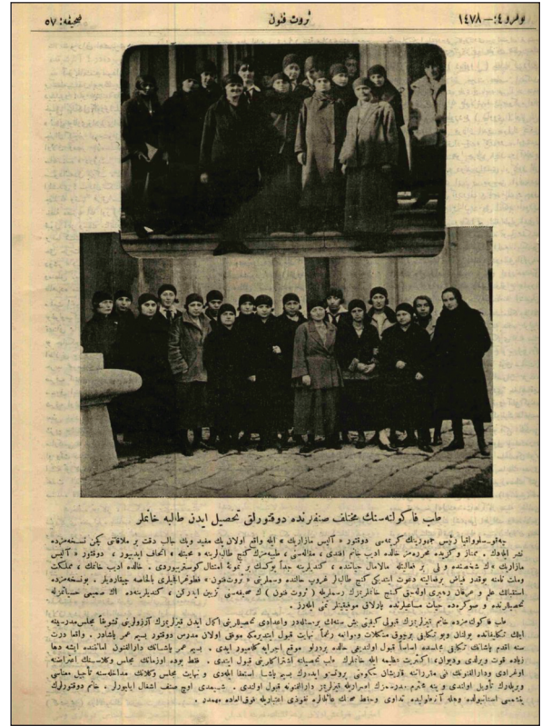
RESİM 2: Tıp fakültesinde muhtelif sınıflarda doktorluk tahsil iden hanımlar” Servet-i Fünun, Cilt: 57. Cilt , Sayı: 1478 11 Aralık 1924 (Miladi) 11 Kanunuevvel 1340 (Rumi).

1922 senesinde Cenevre’de Beynelminel Tabibeler Kongresi’nin gerçekleştiği ve kongrede pek çok konu ile birlikte tabibelerin vaziyetlerinin de değerlendirildiği, tabibelerin aralarındaki münasebet ve muavenetin değerlendirildiği ve mesleğe ait hususların müzakere edildiği, Darülfünun Mecmuası’nın 7 Temmuz 1922 tarihli sayısında yayımlanmıştır. Bu beynelmile hareketler ülkemizde de aynı yıl kız talebelerin Besim Ömer Paşa’nın da gayretiyle tıp ders-