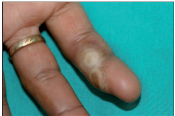
RESİM 2: Parmak fleksör yüzünde papüloveziküler lezyonlar.