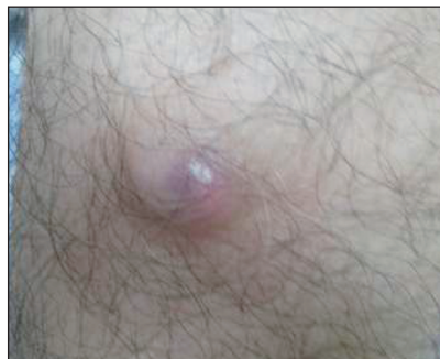
RESİM 1: Sağ ön kol fleksör yüzünde 2 cm çapında, mavi-mor renkli ağrısız sert nodüler lezyon görülmektedir.

A ltmış üç yaşındaki erkek olgu, sağ ön kolda üç aydan beri var olan lezyon şikâyeti ile başvurdu. Olgunun öyküsünde; bu lezyona ağrı, kaşıntı, yanma, batma gibi herhangi bir semptomun eşlik etmediği ve lezyon bölgesine bir travma öyküsünün olmadığı öğrenildi. Daha önce kendinde ve ailesinde benzer bir lezyon öyküsü vermeyen olgunun öz geçmişi, soy geçmişi ve sistem sorgulamasında herhangi bir özellik bulunmamaktadı. Dermatolojik muayenede sağ ön kol fleksör yüzünde 2 cm çapında mavi-mor renkli ağrısız sert nodüler lezyon saptandı (Resim 1). Tam kan sayımı ve karaciğer fonksiyon testlerini de içeren rutin laboratuvar testleri normaldi. Lezyon total olarak eksize edildi. Lezyonun histopatolojik incelenmesinde bazaloid hücre kümeleri ve hayalet hücreleri görüldü (Resim 2).