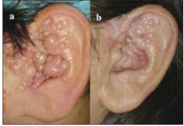
RESİM 2: a) Sol kulakta yerleşim gösteren ve dış kulak yolunda obstrüksiyona neden olan papülonodüler trikoepitelyoma lezyonları tedavi öncesi, b) radyofrekans elektrocerrahi tedavisinden altı ay sonraki klinik görünüm.