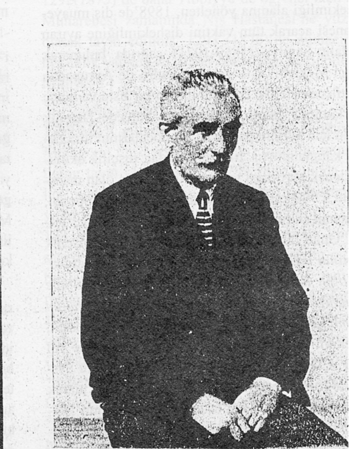
Resim 1. Prof.Dr. Mustafa Münif Paşa (Kocaoğlan).