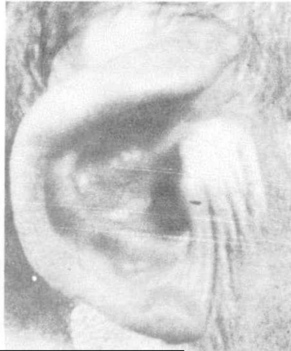
Şekil 2. Düşük Kulak