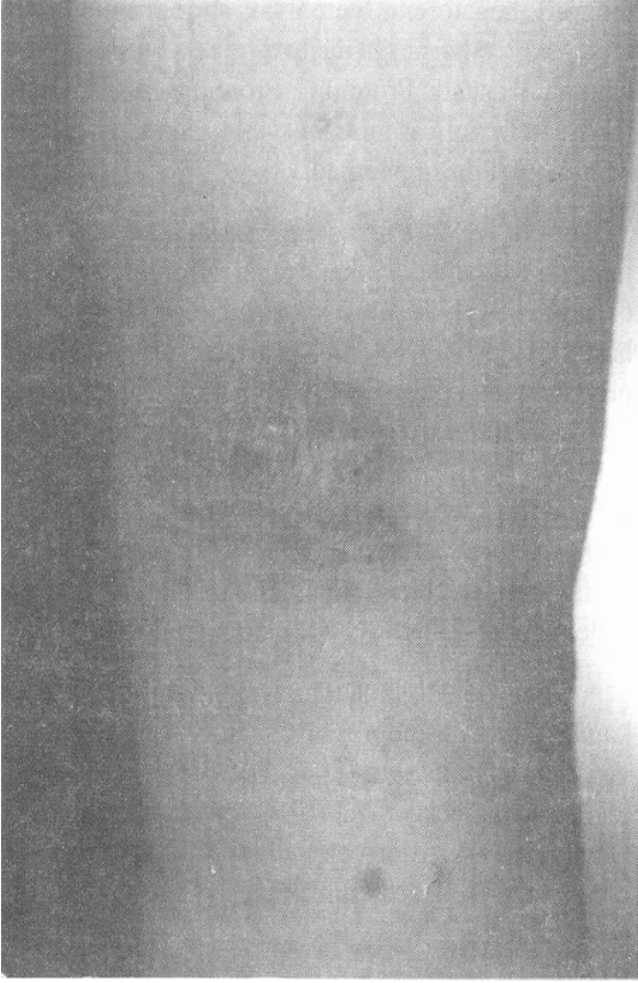
Şekil 1. Sağ uylukta saptanan kırmızı, cilt altı yerleşimli, sert ağrılı nodül.

topenin de ortaya çıkması üzerine dissemine intravasküler koagülopati düşünüldü. Laboratuvar olarak da fibrinojen düzeylerinde düşüklük, protrombin zamanı ve aPTT'de uzama ile fibrin yıkım ürünlerinde artış saptanmasıyla hastaya destek tedavisi (torbada taze kan, taze donmuş plazma, kuru fibrinojen) başlandı, tedavinin 9. gününde hasta dissemine intravasküler koagülopati tablosundan çıktı. Hasta halen sadece kanamalarına yönelik olarak aldığı p.o. traneksamik asit tedavisi ile takip edilmektedir.