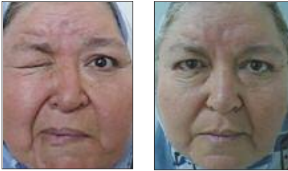
RESİM 2: Hemifasiyal spazmlı olgunun Botox uygulamasından önceki ve sonraki görünümü.