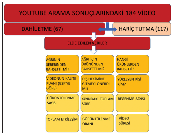
ŞEKİL 2: Analiz sonucunda videolardan elde edilen verileri.