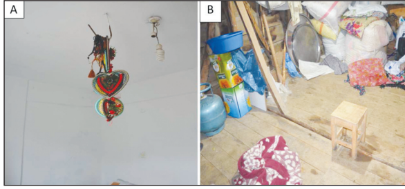
RESİM 1: A) Evde tam ası için kullanılan tavan demiri, B) İntihar için seçilen ev eklentisi (kiler, depo).

ların %10,1'inde (n=13) fiziksel şiddet bulguları ve bir olguda ise cinsel saldırı bulguları tespit edildi. Fiziksel istismar bulgularının genç ve genç erişkin yaş döneminde (0-30 yaş) anlamlı derecede fazla olduğu bulundu ( \chi^2 : 6813, SS: 2, p=0,033). Dokuz olguda kendine zarar verme eylemine yönelik fiziksel bulgular saptandı. Olgulardan alınan kan, idrar, göz içi sıvısı ve organ örneklerinin toksikolojik analizinde, olguların %50,4'ünde (n=65) psikiyatrik tedaviye yönelik ilaç etken maddeleri, 5 olguda alkol ve uyuşturucu madde tespit edildi (Tablo 3). Diğer intihar sebepleri olarak da ticari ve öğrenim başarısızlığı,