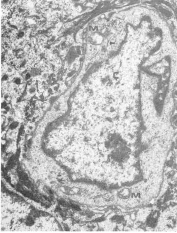
Şekil 2. Normal deride bir Langerhans hüresinin elektron mikrografı. Ç: Çekirdek, M: mitokondriyon;1 -: Birbeck granülleri. Boya: Sato, X 16450. (A.N. Çakar izniyle, ref. 19).